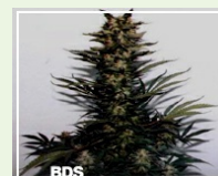
Haze 40,00EUR 28,00EUR